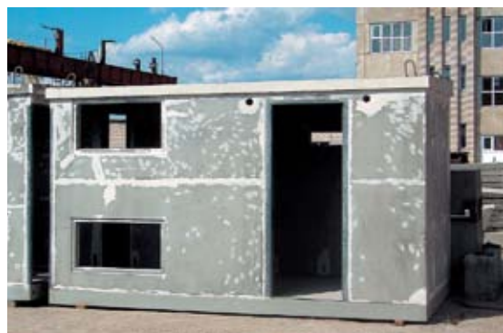
Готовые ЖБИ-корпуса для электроподстанций – еще одни нестандартные изделия, изготовление которых входит в компетенцию УС-620.