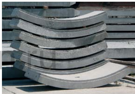
При изготовлении стенок для МЕТРОПОЛИТЕНА в Москве и Казани специалисты «УС-620» изготовили сегменты с металлоизоляцией.