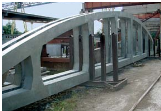
Для ЗАВОДА «РОЛЛТОН» были изготовлены железобетонные колонны, фермы и плиты покрытия. «УС-620» возводило производственные цеха, складские помещения и административные здания.