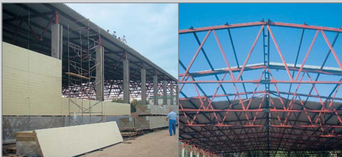
ПРОИЗВОДСТВЕННЫЙ, АДМИНИСТРАТИВНО- БЫТОВОЙ КОРПУС «РУСПРИНТ», Г. ВИДНОЕ МОС. ОБЛ.