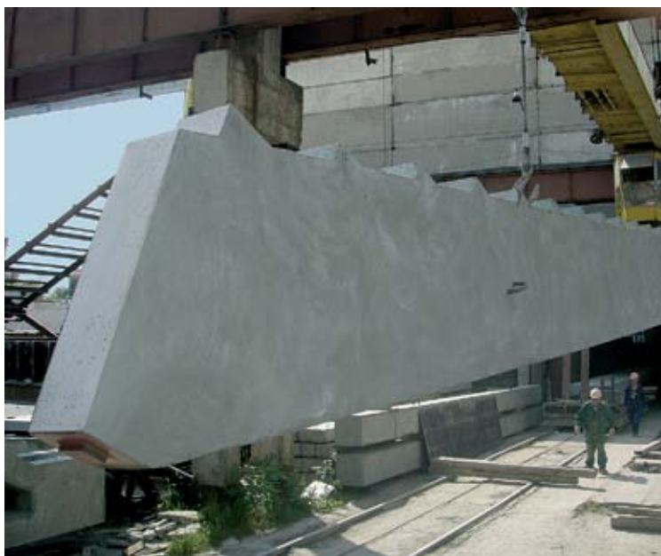
Один из известнейших проектов «УС-620» — СТАДИОН «НОВАТОР» в г. Химки. Для создания нестандартных трибун стадиона мы изготовили 28 уникальных форм. Работа велась 20 месяцев.

Кроме изготовления стандартных изделий, мы готовы производить ЖБИ по заказу, быстро изготавливая формы по проектам.