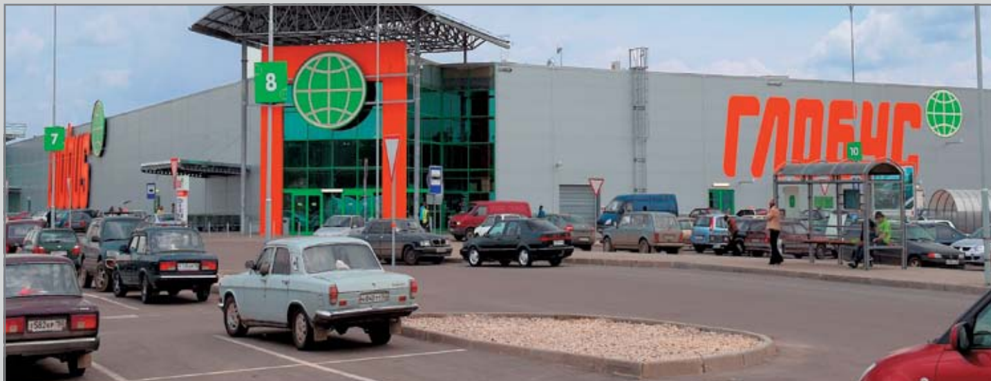
ГИПЕРМАРКЕТЫ «ГЛОБУС» В Г. КЛИМОВСКЕ МОС. ОБЛ., В РЯЗАНИ, В ЯРОСЛАВЛЕ