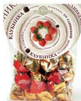
Клубника со сливками

6 видов Масса нетто пакета 200 г 12 пакетов в коробе Масса нетто коробка 2,4 кг