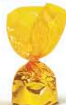
Абрикос со сливками