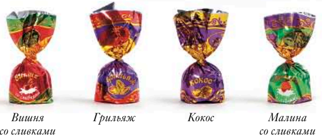
Вишня со сливками