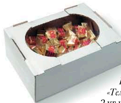
Короб «Телевизор» 2 кг или 1,7 кг