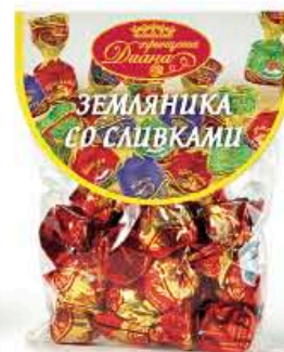
Земляника со сливками