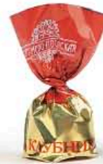
Клубника со сливками