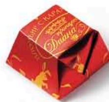
Пломбир с карамелью