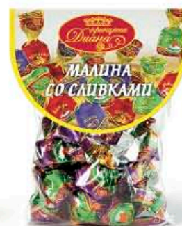
Малина со сливками