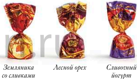
Земляника со сливками