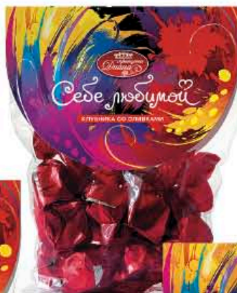
Клубника со сливками