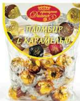
Пломбир с карамелью