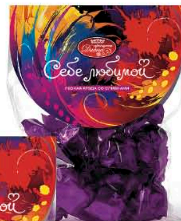
Лесная ягода со сливками