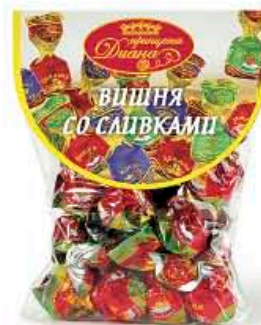
Вишня со сливками