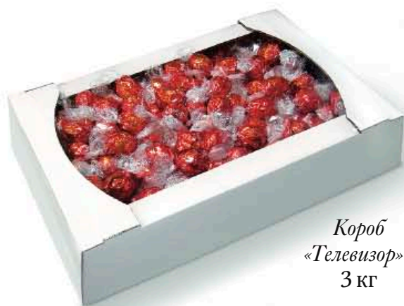
Короб «Телевизор» 3 кг