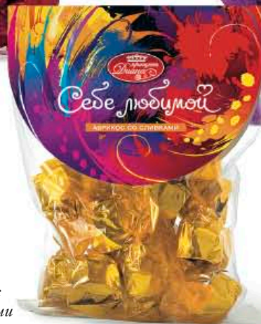
Абрикос со сливками