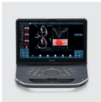
Vivid iq Premium