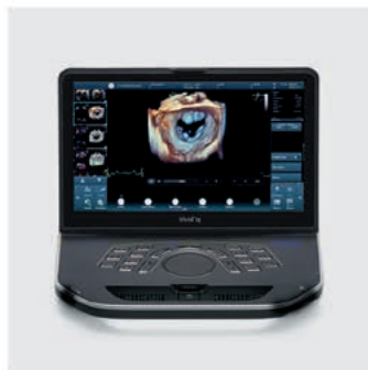
Vivid iq 4D