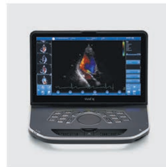
Vivid iq Value